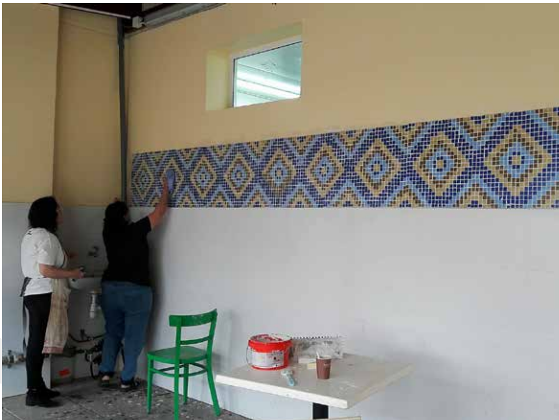
תלמידי סדנת הפסיפס בהנחיית האמנית דינה פריד, מכינים פסיפס קבוצתי ותולים אותו על קיר המכללה