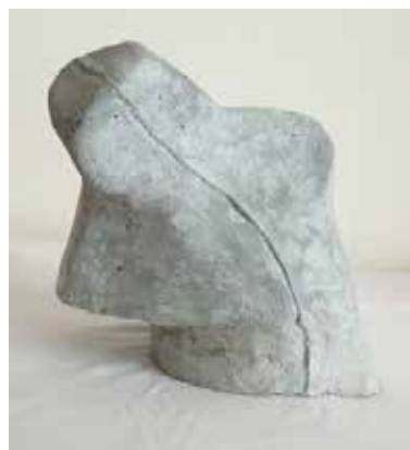
סארה אבו ג'יליון