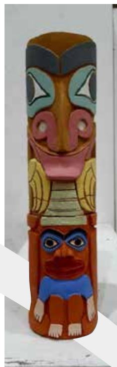
אברהם (מיקו) גבאי