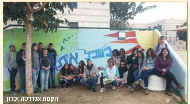
הקמת אנדרטה זכרון

שילוב הסטודנטים בכיתות יצר למידה מסוג אחר אצל התלמידים, הסטודנטים חשפו את התלמידים לרבדים השונים של הנושא והתלמידים בחרו נושאים שמעניינים אותם וחקרו אותם בקבוצות קטנות. חקירת הנושא לעומק והאפשרות ליצור תוצר, יצרה אצל התלמידים מוטיבציה לימודית מסוג אחר. בסיום הלמידה התלמידים בהכוננת הסטודנטים ערכו תערוכת מוצגים ועבודות בנושא אשר מטרתה לתת ביטוי לשאלות שנשאלו במשך הלמידה, הורים וצוות ביה"ס הוזמנו לתערוכה שקצרה שבחים רבים. ביה"ס אשל - הנשיא מעריך את עבודתם והשקעתם של הסטודנטים והצוות המלווה ורואה ברכה בשיתוף הפעולה הפורה שתורם להעשרת התלמידים ולחוויה לימודית משמעותית בקרב התלמידים.